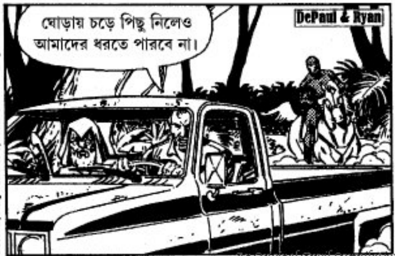
An Original Devil Complication

ঘোড়ায় চড়ে পিছু নিলেও আমাদের ধরতে পারবে না।